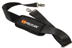
9487 Bandoulière rembourrée