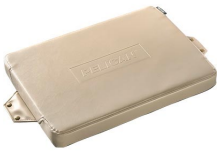
50Q-SEAT-TAN Amortiguamiento de asiento