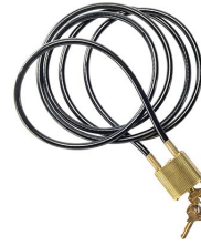
CL1 Cable Lock