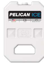
PI-2LB 2lb Ice Pack