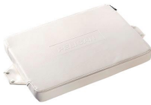
50Q-SEAT-WHT Amortiguamiento de asiento