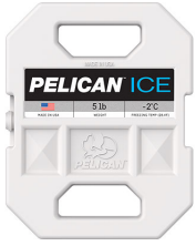
PI-5LB 5lb Ice Pack