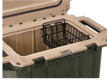
50-WB Cesta de rejilla de secado