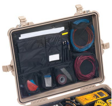
1609 Organizador de tapa