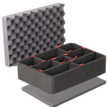
iM2200TPKIT Kit de divisores TrekPak