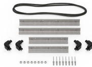
iM2200-BEZEL Kit de bisel para base