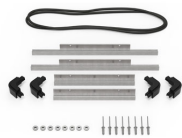
iM2200-BEZEL-LID Marco para instalaciones electrónicas con tapa