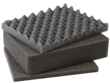
1201 Juego de 3 piezas de espuma de recambio