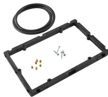
1200PF Marco de panel para aplicaciones especiales