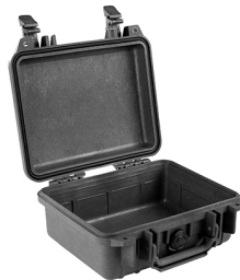
1200NF No Foam