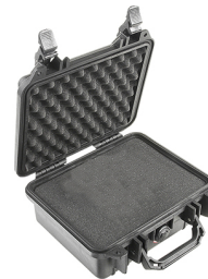
1200WF With Foam