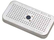
1500D El gel de sílice desecante Peli