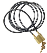
CL1 Cable Lock