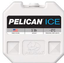
PI-1LB 1lb Ice Pack