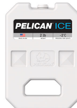
PI-2LB 2lb Ice Pack