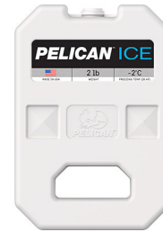
PI-2LB Bloc réfrigérant 2 lb