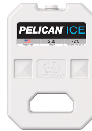
PI-2LB Bloc réfrigérant 2 lb