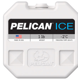
PI-1LB Bloc réfrigérant 1 lb