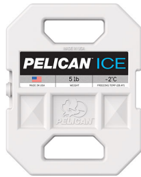
PI-5LB Bloc réfrigérant 5 lb