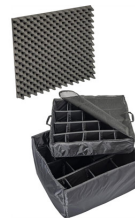
1635 Cloison en mousse