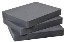
1632 Pick N Pluck; sections seulement (jeu de 3)