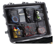
1639 Pochette couvercle