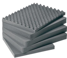
1611 Jeu de mousses de rechange, 5 pièces