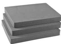
1612 Pick N Pluck; sections seulement (jeu de 3)