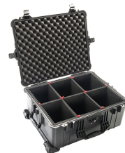
1610TP With TrekPak Divider System