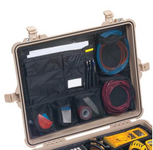
1609 Pochette couvercle