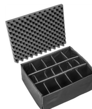
1615 Cloison en mousse