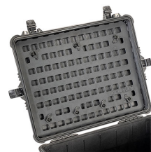
1610MP EZ-Click™ MOLLE Panel