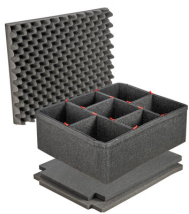
1610TPKIT Kit de séparation de la valise TrekPak