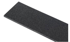
1120TPDIV Séparateurs TrekPak supplémentaires