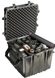
0354 With Padded Dividers