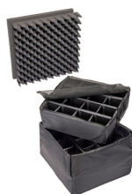
0355 Cloison en mousse