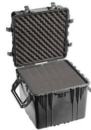
0350WF With Foam