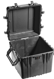
0350NF No Foam