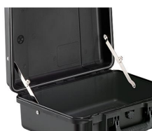
iM-LIDSTAY Compas de couvercle