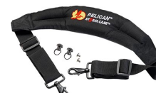
iM-STRAP-S-VER2 Bandoulière rembourrée