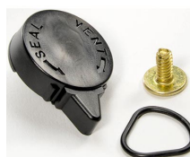
iM-VALVE-M-B Soupape de purge manuelle