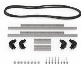
iM2306-BEZEL-LID Trousse de cadre de couvercle