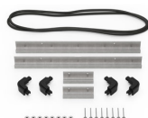
iM2306-BEZEL Support de platine base