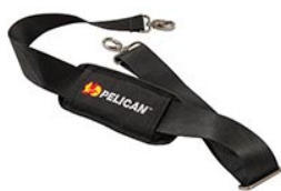
9487 Padded Shoulder Strap