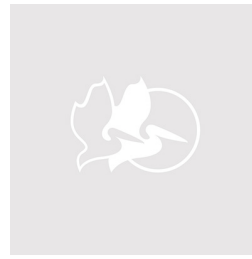
472-M16M203M9-S With Black Stainless Steel Hardware