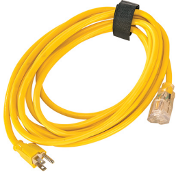
9606 Power Cable