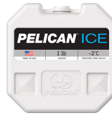
PI-1LB 1lb Ice Pack