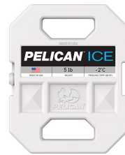
PI-5LB 5lb Ice Pack