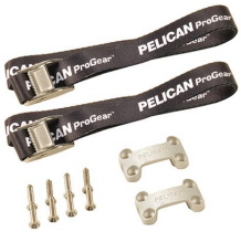
TDKIT Kit de sujeciones