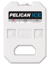
PI-2LB 2lb Ice Pack