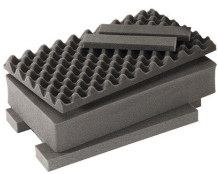
1535AirFS Juego de 3 piezas de espuma de recambio