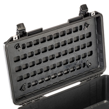
1535MP EZ-Click™ MOLLE Panel