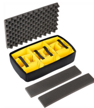
1535AirDS Divisores acolchados