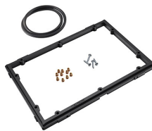
1150PF Marco de panel para aplicaciones especiales