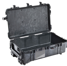
1670NF No Foam