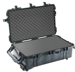
1670WF With Foam