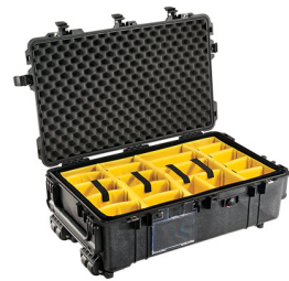
1674 With Padded Dividers