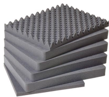
1621 Juego de 6 piezas de espuma de recambio