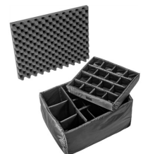
1625 Divisores acolchados