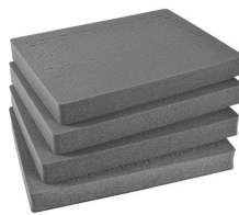
1622 Pick N Pluck™ Sections Only (set of 4)