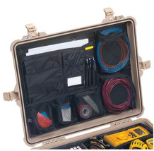
1609 Organizador de tapa