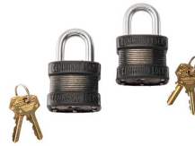
PL2 Padlock (2 pack)