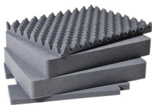
1561 Juego de 4 piezas de espuma de recambio