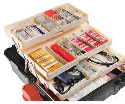
1466 Sistema de bandejas para 1460EMS