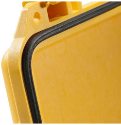
1463 Replacement O-ring