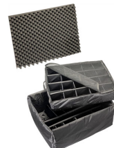
1695 Divisores acolchados