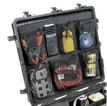
1699 Organizador de tapa