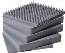
1641 Juego de 5 piezas de espuma de recambio