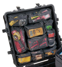
0379 Organizador de tapa