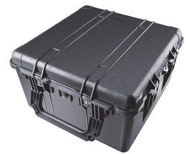
1640WF With Foam