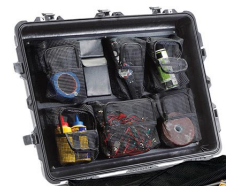
1639 Organizador de tapa