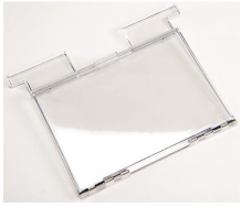
1630DC Accesorio portadocumentos