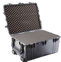
1630WF With Foam