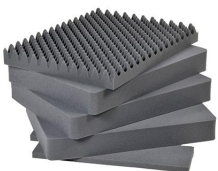
1631 Juego de 5 piezas de espuma de recambio