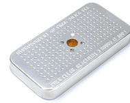
1500D Gel de sílice desecante