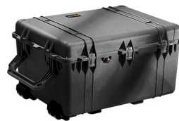
1630NF No Foam