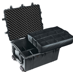
1634 With Padded Dividers