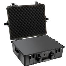
1600WF With Foam