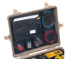
1609 Organizador de tapa