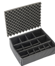
1605 Divisores acolchados