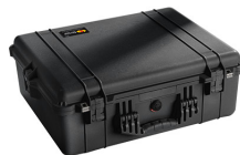
1600NF No Foam