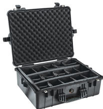
1604 With Padded Dividers