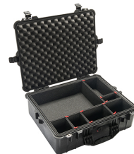
1600TP With TrekPak Divider System