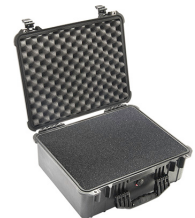
1550WF With Foam