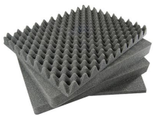
1551 Juego de 4 piezas de espuma de recambio