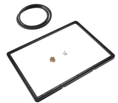
1550PF Panel de adaptación para aplicación especial