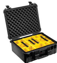
1554 With Padded Dividers