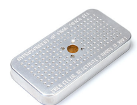
1500D Gel de sílice desecante