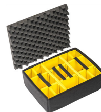
1555 Divisores acolchados