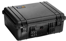
1550NF No Foam