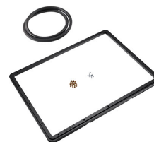
1550PF Marco de panel para aplicaciones especiales