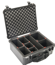
1550TP With TrekPak Divider System