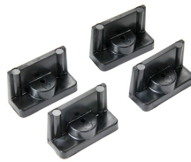
1507 Soportes de montaje rápido - juego de 4