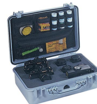
1508 Organizador de tapa para material de fotografía