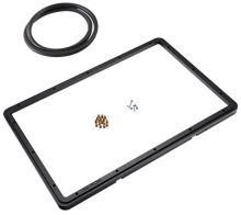
1500PF Marco de panel para aplicaciones especiales