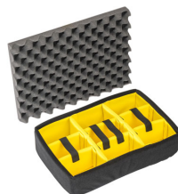
1505 Divisores acolchados