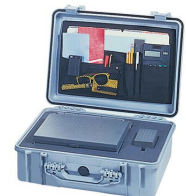
1509 Organizador de tapa