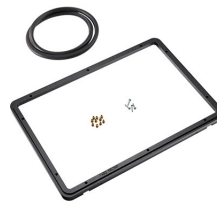
1450PF Marco de panel para aplicaciones especiales