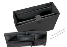
1436 Office Divider Kit