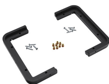
1430PF Panel de adaptación para aplicación especial