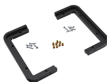
1430PF Panel de adaptación para aplicación especial