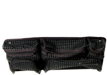
1439 Organizador de tapa