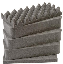
1431 Juego de 5 piezas de espuma de recambio