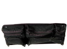
1439 Organizador de tapa