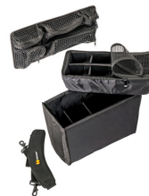
1435 Divisores acolchados