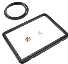
1400PF Panel de adaptación para aplicación especial