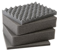
1301 Juego de 4 piezas de espuma de recambio