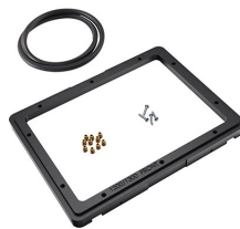
1200PF Panel de adaptación para aplicación especial