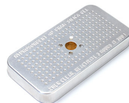
1500D Gel de sílice desecante