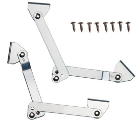
KIT-LIDSTAY-CARGO Cargo Lid Stays