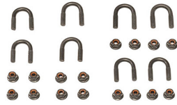
RFMTTC2 Roof Mount Tubular Clamp Kit