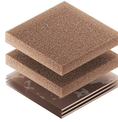
1500CI Corrosion Intercept Kit