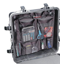
0359 Organizador de tapa