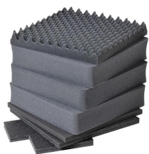
0351 Juego de 7 piezas de espuma de recambio