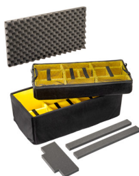
1626AirDS Divisores acolchados