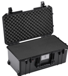
1556WF With Foam