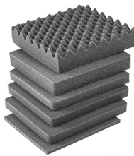
iM2275-FOAM Juego de 4 piezas de espuma de recambio