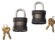
PL2 Padlock (2 pack)