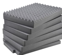
iM3075-FOAM Juego de 7 piezas de espuma de recambio