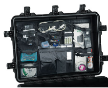
iM3075-UTILITYORG Organizador de accesorios