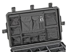
iM30XX-UTILITYORG Organizador de accesorios