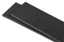
iM2950TPDIV Extra TrekPak Dividers