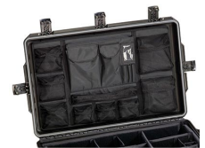
iM29XX-UTILITYORG Organizador de accesorios