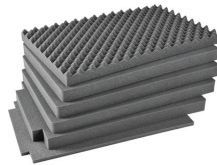
iM2950-FOAM Juego de 6 piezas de espuma de recambio