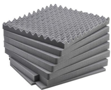
iM2875-FOAM Juego de 7 piezas de espuma de recambio