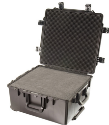
iM2875-X0001 With Foam