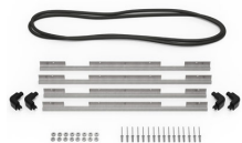
iM2875-BEZEL-LID Marco para instalaciones electrónicas con tapa