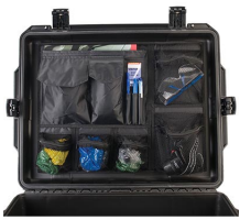
iM27XX-UTILITYORG Organizador de accesorios