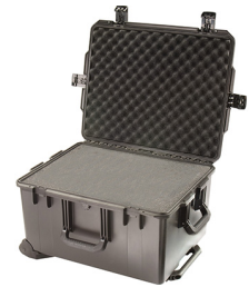
iM2750-X0001 With Foam