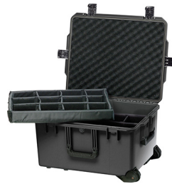
iM2750-X0002 With Padded Dividers