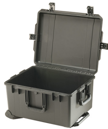
iM2750-X0000 No Foam