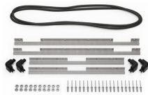
iM2750-BEZEL-LID Marco para instalaciones electrónicas con tapa