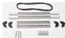
iM27XX-BEZEL-LID Marco para instalaciones electrónicas con tapa