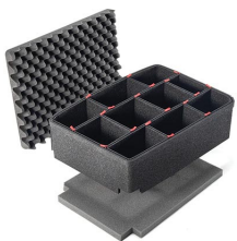
iM2720TPKIT TrekPak Case Divider Kit