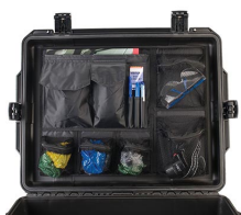
iM27XX-UTILITYORG Organizador de accesorios