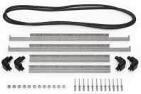
iM2600-BEZEL-LID Marco para instalaciones electrónicas con tapa