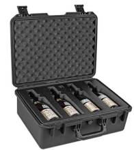
WHISKY-MULTIB Quad Whiskey