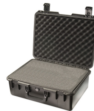
iM2600-X0001 With Foam