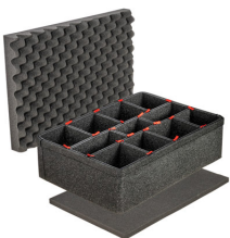
iM2600TPKIT Kit de divisores TrekPak