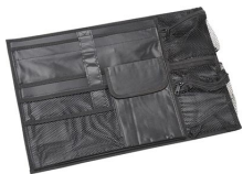
iM2500-UTILITYORG Organizador de accesorios