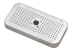
1500D El gel de sílice desecante Peli