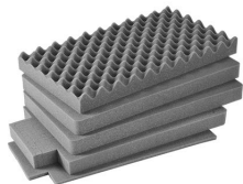
iM2500-FOAM Juego de 5 piezas de espuma de recambio