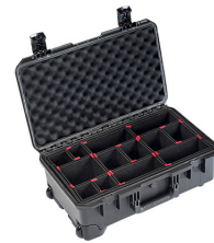
iM2500-X0006 With TrekPak Divider System