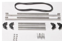
iM2500-BEZEL-LID Marco para instalaciones electrónicas con tapa