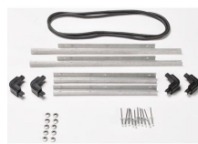
iM24XX-BEZEL-LID Marco para instalaciones electrónicas con tapa