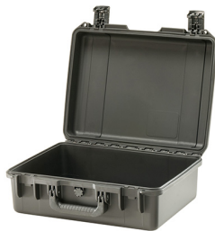
iM2400-X0000 No Foam