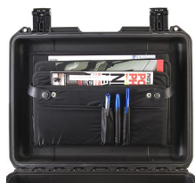
iM24XX-LIDORG Organizador de tapa