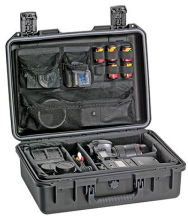
iM24XX-PHOTOPALLET Pálet para fotografía