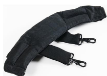
iM2370-STRAP-S Correa para hombro acolchada removible