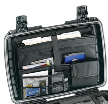
iM2370-UTILITYORG Organizador de accesorios