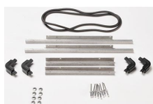
iM2306-BEZEL-LID Marco para instalaciones electrónicas con tapa