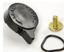
iM-VALVE-M-B Válvula de purga manual