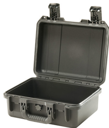
iM2100-X0000 No Foam