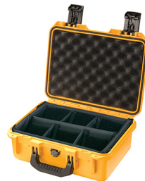
iM2100-X0002 With Padded Dividers