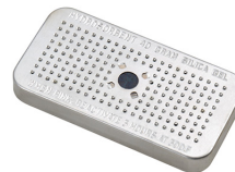
1500D El gel de sílice desecante Peli