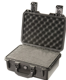
iM2100-X0001 With Foam