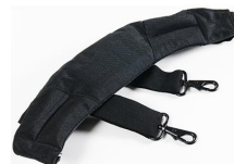
iM-STRAP-S-VER2 Correa para hombro acolchada